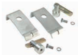
Anschraubbarer PAL PAK

*Einschließlich zwei anschraubbarer Haltestifte und zwei Halteplatten